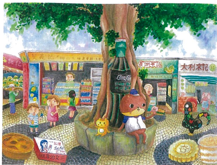
「中學組——創意藝術比賽」 亞軍作品。

🏠 氹仔舊城區藝術空間 (逢周一休館) 🕒 即日起至4月13日 (12:00-20:00) 🆓 免費